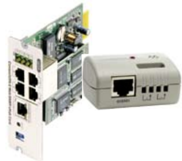
Рис. 3 Опции: адаптер Web/SNMP и Датчик параметров окружающей среды для измерения уровня температуры внешних батарейных шкафов и стеллажей.

В интересах совершенствования продукции компания оставляет за собой право изменения параметров спецификации без предварительного уведомления.